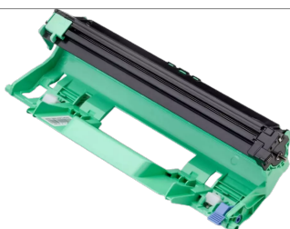
Bęben Obrazowy (DR-1090)