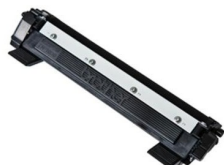
Toner Czarny (TN-1090)